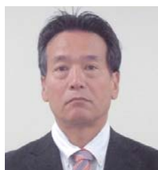
資産課税統括官 深川 賢一