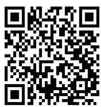
チャットボットは こちらから