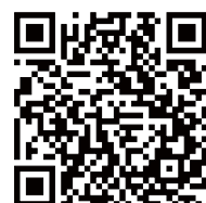
タックスアンサーは こちらから