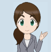
チャットボット (税務職員ふたば)

ご質問したいことをメニューから選択するか自由 に文字で入力すると、AI（人工知能）が自動 回答します。